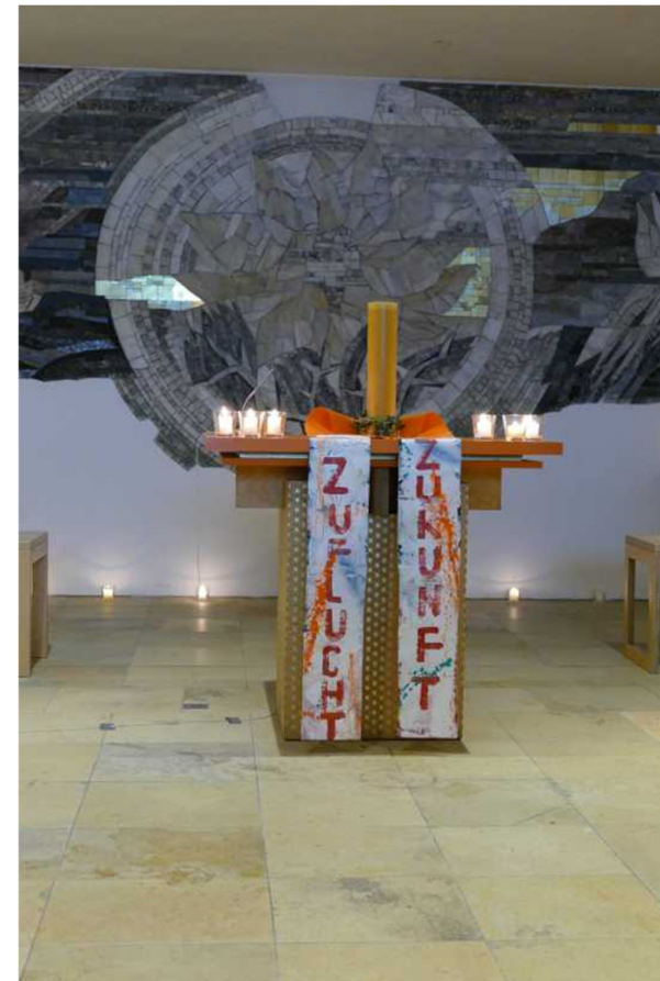
Altarbild zur Kunst.Andacht am 28.04.24