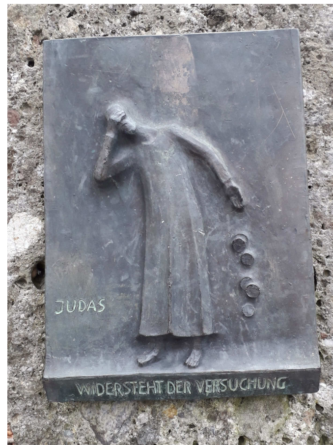
Kreuzwegtafel von Sepp Hamberger am Petersberg