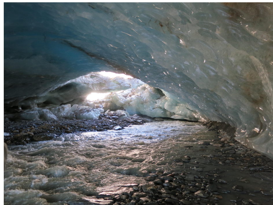
Gletschertor im Langtaufferer Tal

Wenn du dein Land ändern willst, musst du erst einmal dein Dorf ändern, wenn du dein Dorf ändern willst, musst du erst einmal deine Familie ändern, und wenn du deine Familie ändern willst, musst du erst einmal dich selbst ändern.