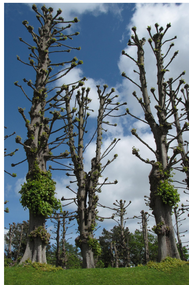
Im Garten von Schloss Frederiksborg, Dänemark